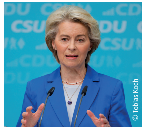
Kommissionspräsidentin Ursula von der Leyen ist Spitzenkandidatin der EVP

sichere Zukunft Europas ein. Wir stehen für eine gemeinsame Verteidigung in der NATO und eine konsequente Bekämpfung von Bedrohungen von innen und außen. Wir unterstützen die Ukraine im Kampf gegen den russischen Angriffskrieg und setzen uns für eine geregelte Migrationspolitik ein. Jede Stimme für die CDU ist eine Stimme für Freiheit, Frieden und Sicherheit in Europa!